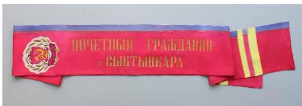
Нагрудная лента П.Г. Чебанова И.И. 1967 г.