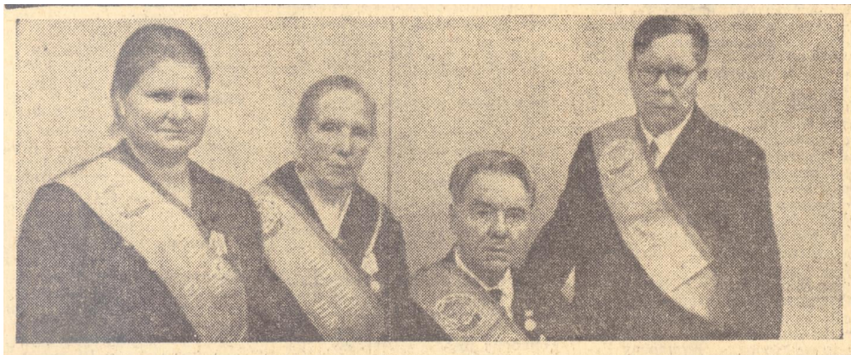
Первые почетные граждане. 08.11.1967 г.

изображение герба города Сыктывкара. С этого времени почетным гражданам стало выдаваться свидетельство.