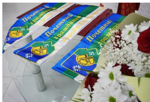
Нагрудная лента ПГ Сыктывкара 2022

Решением Совета города Сыктывкар от 8 мая 1998 г. было отменено предыдущее Положение о присвоении звания «Почетный гражданин города Сыктывкара» и утверждено новое, в соответствии с которым кандидату в почетные граждане необходимо прожить в столице республики не менее 20 лет. При администрации города учреждалась специальная Книга почета граждан города.