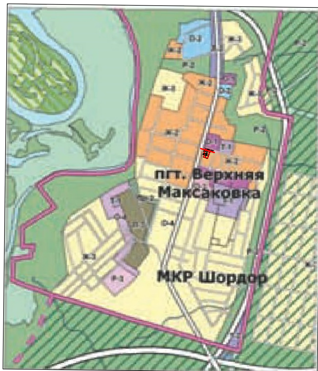
Схема расположения земельного участка в границах элемента планировочной структуры (квартал)